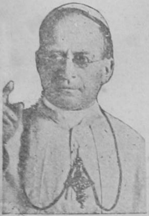
S. S. EL PAPA

EL NOMBRAMIENTO DE MONSEÑOR CICOGNANI COMO NUNCIO EN BURGOS SIGNIFICA EL RECONOCIMIENTO DE JURE